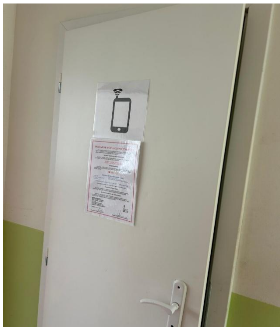
Obrázok: Miestnosť určená na telefonovanie.

Z rozhovorov vyplynulo, že listová korešpondencia, ako aj telefonické hovory detí, nie sú kontrolované , čím je zabezpečený dostatočný priestor na súkromie. 16 V tejto súvislosti komisár pre deti ako príklad dobrej praxe hodnotí, že v zariadení bola na odporúčanie Generálnej prokuratúry SR zriadená samostatná miestnosť určená na telefonovanie v súkromí. Zariadenie zároveň uviedlo, že napriek tomu, že sa aj naďalej môžu vyskytnúť rizikové situácie (napr. plánovanie úteku zo strany dieťaťa), v rámci svojich možností sa snaží rešpektovať a uplatňovať odporúčania kontrolných orgánov.