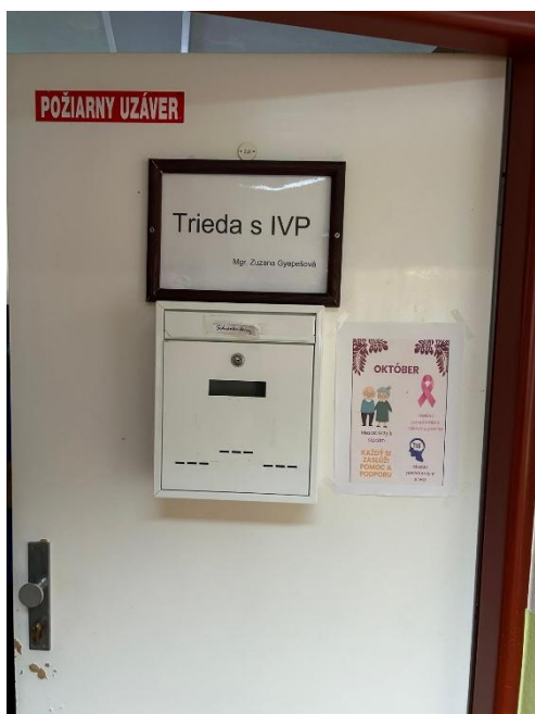
Obrázok: schránka dôvery

Podľa vyjadrenia psychologičky však schránka dôvery aktuálne nie je deťmi využívaná , využívajú skôr osobný rozhovor, resp. priestor na komunitu.