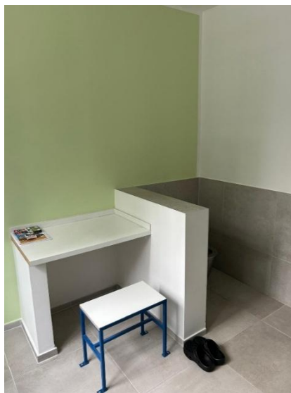
Obrázky: Ochranná miestnosť.