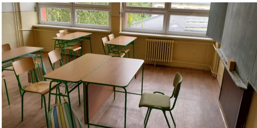
Obrázok č. 3: Učebňa v škole