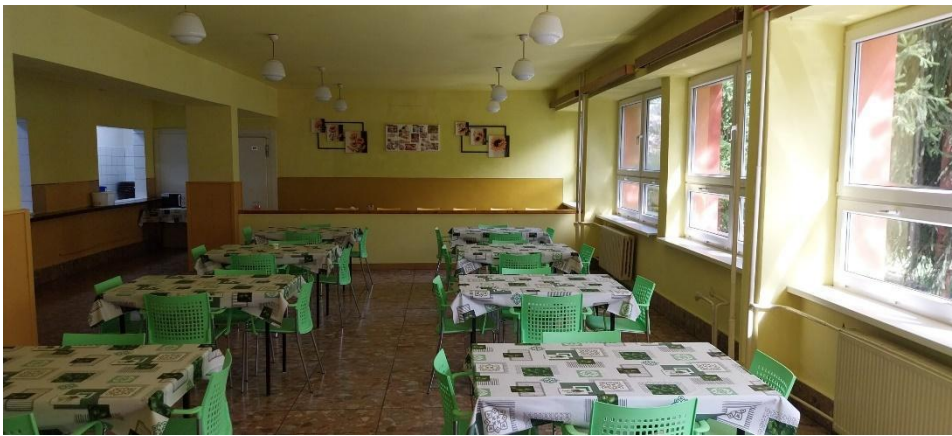
Obrázok č. 4 - 5: Izba a jedáleň