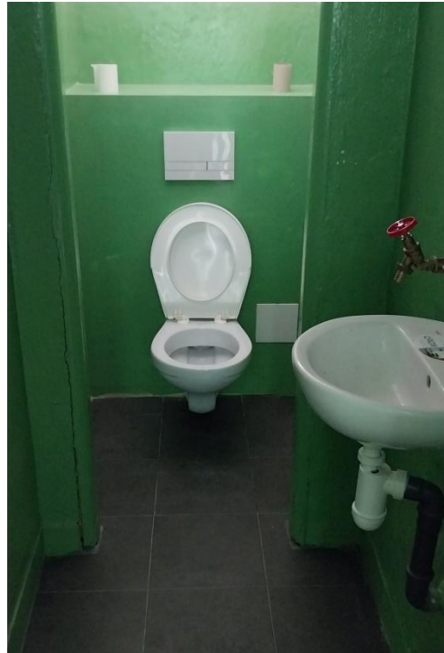
Obrázok č. 6 - 7: Ochranná miestnosť a toaleta