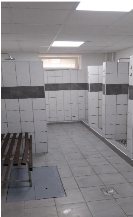
Obrázok č. 8 - 9: Kúpeľňa a toalety

V danom prípade sa konštatuje, že je potrebné zabezpečiť, aby chlapcov pri výkone osobnej hygieny bolo čo najmenej, z dôvodu zabezpečenia maximálneho možného súkromia a súčasne, aby to bolo časovo zvládnuteľné. Žiadame tiež o vyjadrenie k dodatočnému zabezpečeniu závesov a paravánov pri sprchách.