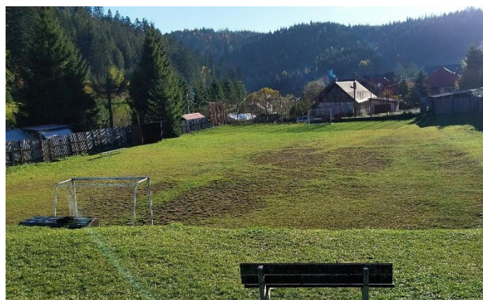
Obrázok č. 3 a 4: Spoločenské priestory a vonkajšie priestory RC