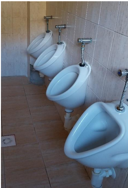
Obrázok č. 9 - 11: Kúpeľňa a toalety

Dvere na sociálnych zariadeniach nie je možné z bezpečnostných dôvodov zamknúť, dokonca ani zavrieť, nakoľko kľučky boli odstránené. Toalety a kúpeľne by však mali byť vybavené prvkami na ochranu súkromia. 21 V závislosti od rozumovej a vôľovej vyspelosti dieťaťa, by dieťa malo mať možnosť uzamknúť (resp. minimálne dvere riadne zavrieť) počas hygieny, napríklad pomocou otočných zámkov, ktoré môže personál z bezpečnostných dôvodov otvoriť zvonku.