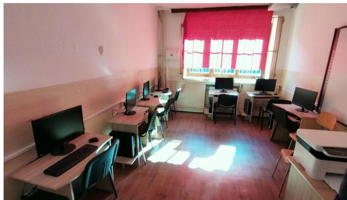
Obrázok č. 4 a 5: učebňa v škole, počítačová miestnosť