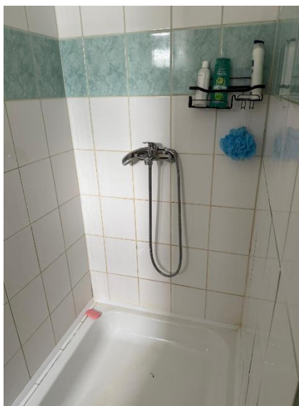
Obrázky: Kúpeľňa a toalety